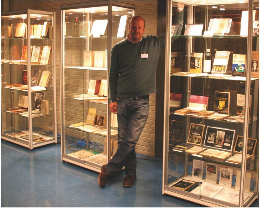
Verzamelaar en verzameling, Utrecht 2005